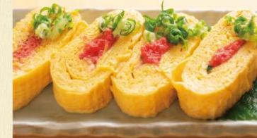
明太子だし巻(限定10品) 660円