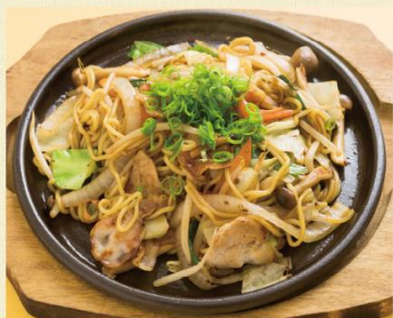
ソース焼きそば 1,230円