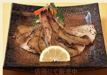
カレーの一夜干し 880円