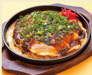
広島風お好み焼き 1,280円