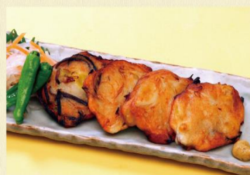
自家製さつまあげ 660円