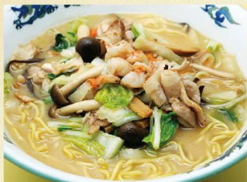
芸南チャンポン 1,320円 ミニチャンポン 1,200円